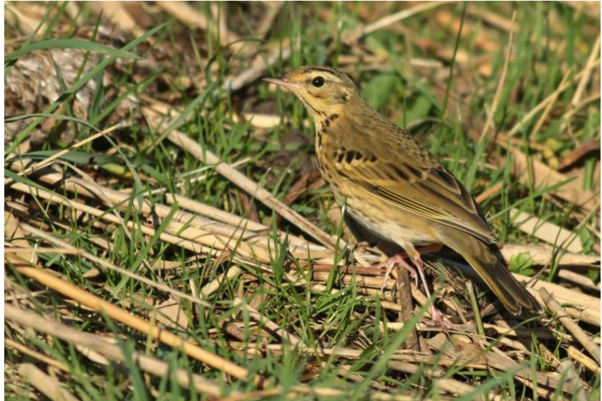
Siberische Boompieper

De eerste keer dat deze soort in het werkgebied van Natuurvereniging Wierhaven werd gevonden was door Laurens van der Vaart op 31 oktober 2012 in het Robbenoordbos. Otto de Vries gaf de zekerheid dat het deze soort betrof, mede door de foto's die Arno ten Hoeve maakte. Dit past dus netjes in het beeld er geschetst wordt in het bovengenoemde boek.