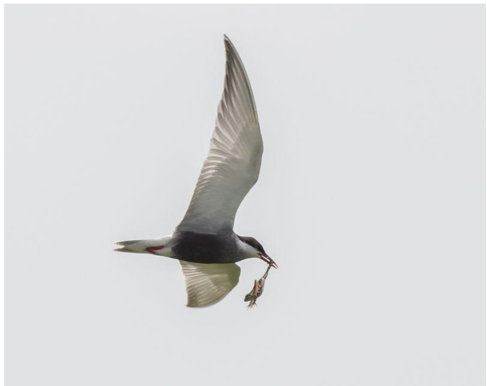
Witwangstern met kikker bij het Zuidlaardermeer

Rest mij Eelke te bedanken voor zijn tips en hulp en uiteraard alle deelnemers voor hun enthousiasme!