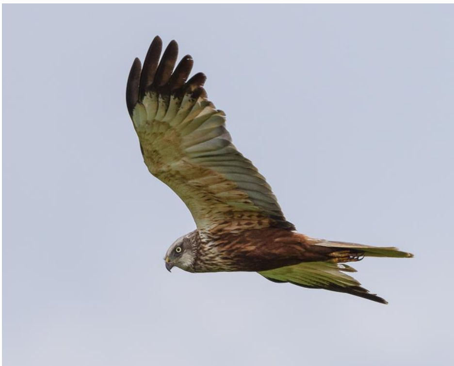
Bruine Kiekendief

Nabij Westerland worden we verrast door een vrouwtje gekraagde roodstaart, die hebben we toch echt niet jaarlijks! Op het Amstelmeer zien we vijf zwarte sterns foerageren en een dodaars. Voor die laatste soort moeten we vaak naar het zuiden van de Wieringermeer, des te verrassender dat we er hier één zien. We maken een rondje om het Amstelmeer en dat levert een tafeleend op. Ook deze soort zien we meestal alleen in het zuiden van de Wieringermeer. Hier dan ook eindelijk een bruine kiekendief.