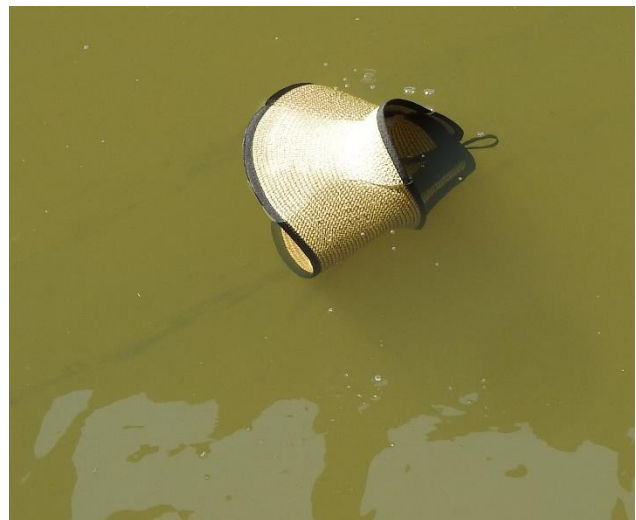
De hoed in de beek

beekrombout zagen we hier ook een smaragdlibel, weidebeekjuffer, vuurjuffer en enkele ooievaars vlogen over. Iets wat ook vloog was de net nieuwe, uit Engeland afkomstige, hoed van één van de deelnemers. Een windvlaag deed de hoed van het hoofd blazen en belandde prompt in de beek en zakte snel naar de bodem. Een scherpe deelnemer wist er een foto van te maken! Gelukkig kon er achteraf om gelachen worden.