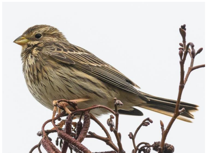
Grauwe Gors

Mijn eerste grauwe gors zag ik op 4 juli 1970 bij Budel. In die tijd maakten wij tochten naar allerlei delen van ons land. Soms speciaal voor bepaalde soorten. Die keer wilden wij de Cetti's zanger horen en zien en dan door naar Budel. Daar zat mijn eerste grauwe gors. Altijd als ik daarna naar het zuiden reed, zorgde ik ervoor dat op mijn wenslijstje de grauwe gors stond, evenals de ortolaan. Twee soorten van Limburg. Heel veel jaren was dit geen enkele probleem totdat de twee soorten sterk achteruit gingen in broedaantallen. Begin van deze eeuw bleek het al niet meer mogelijk een grauwe gors op mijn jaarlijst te krijgen. De ortolaan was al veel eerder uitgestorven als broedvogel van Nederland.