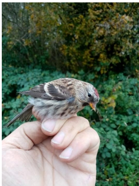
Grote barmsijs man 1 kj