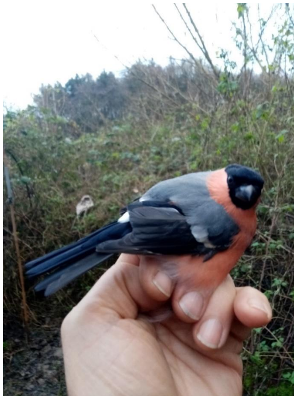
Noordse Goudvink man

Op 11 december ben ik in de gelegenheid een keer tot donker te blijven: 8 Merels , 2 Koperwieken , 1 man Noordse Goudvink naast 2 Vuurgoudhaantjes geringd in najaar 2022.