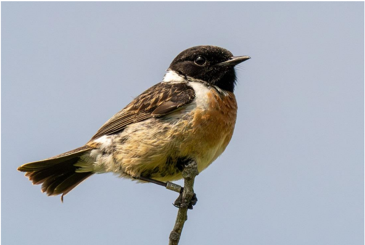
Roodborsttapuit man op CES locatie. Ring net niet compleet afleesbaar, helaas.

Vanaf CES ronde 7 kregen we het verzoek van Sovon om bij elke volgende vangpoging een ontvanger voor vogelgeluiden in ons terrein te plaatsen. Juist bij systematisch onderzoek zou het kansrijk zijn om zo geregistreerde geluiden te vergelijken met “op het oor” vastgestelde vogelroep en -zang. Aanvankelijk waren er wat onduidelijkheden in de handleiding over het doel en de werkwijze en de coördinator kon over het bereik van de ontvanger niets aangeven. Het was voor mij dus niet duidelijk, tot hoever vanaf het apparaat ik de vogelgeluiden nog moest noteren. Bovendien werden er de nodige “digi-technische” vaardigheden gevraagd, waaraan ik niet kon voldoen. Ik weet niet of mijn inspanningen nog ergens toe bijgedragen hebben. Tot het einde van het jaar is er geen terugkoppeling geweest. Ik heb aangegeven dat ik zal afzien van verdere deelname tenzij het voor veldmensen (veel) eenvoudiger gemaakt wordt om mee te doen.