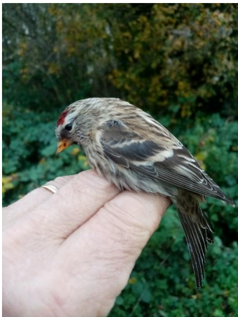
Kleine barmsijs vrouw

Op de laatste dag van de maand weinig te halen in de Voorboezem. Nog wel 1 Ringmus . Overstap naar Leemans, tot donker, levert nog 3 Koperwieken op.