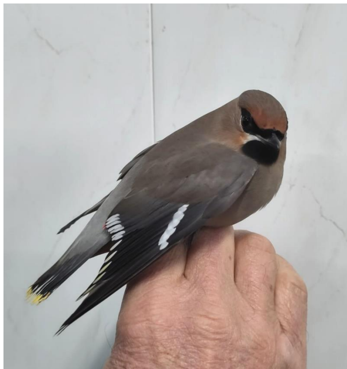
Pestvogel eerstejaars vrouw

Van 3 Pestvogels in december in Hoorn vlogen 2 zich te pletter tegen glas. Of de Pestvogel die 3 december door de dierenambulance werd opgepikt de laatste overgeblevene was, weet ik niet. Ik heb haar (het was een vrouwtje) op 5 december nabij Medemblik vrijgelaten op een plek met wel bessen en geen ruiten, geringd uiteraard. Voor een vogelringer een Sinterklaas cadeautje!