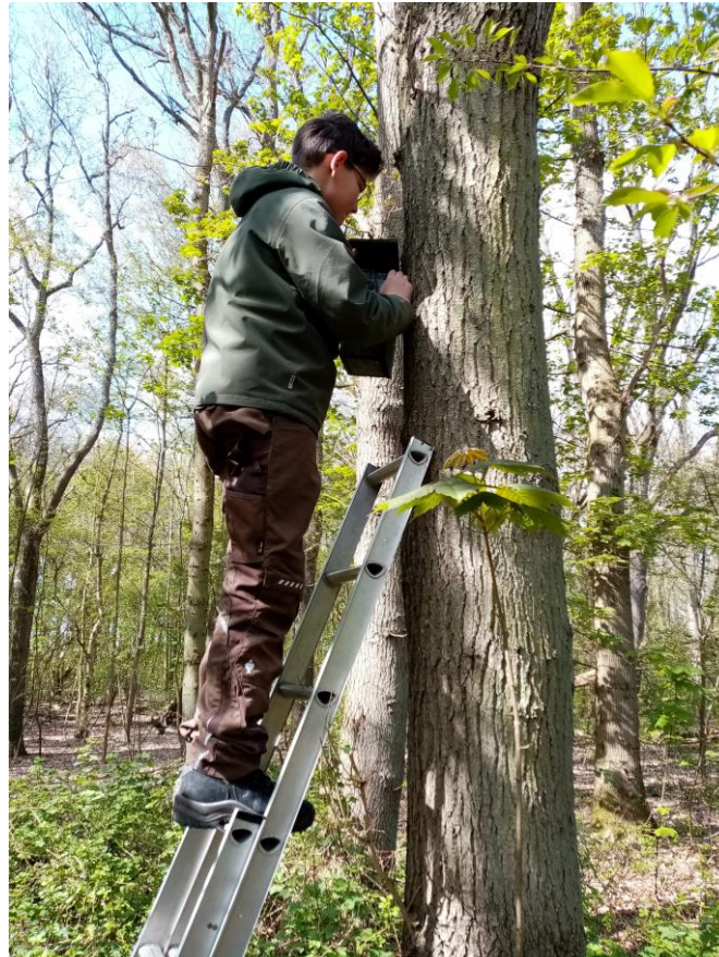
Nathan controleert en fotografeert

C20: 26/04 1 ei; 01/05 6 ei; 06/05 7 ei; 13/05 11 ei; 19/05 14 ei, pas de eerste kans vrouw te controleren. Als op 02/05 het zevende eitje gelegd zou zijn, hadden er op 19/05 jongen moeten zijn! Moet dus wel vervolgbroedsel betreffen; 06/06 6 pullen geringd, 7 ei over.