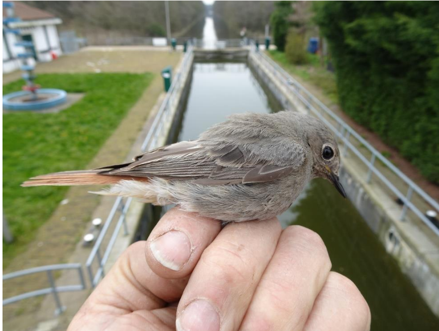
Zwarte roodstaart vrouwkleed

Niet eerder ringde ik 48 Tjiftjaffen in een maand en 227 geringde vogels is bijna het dubbele van vorig jaar maart.