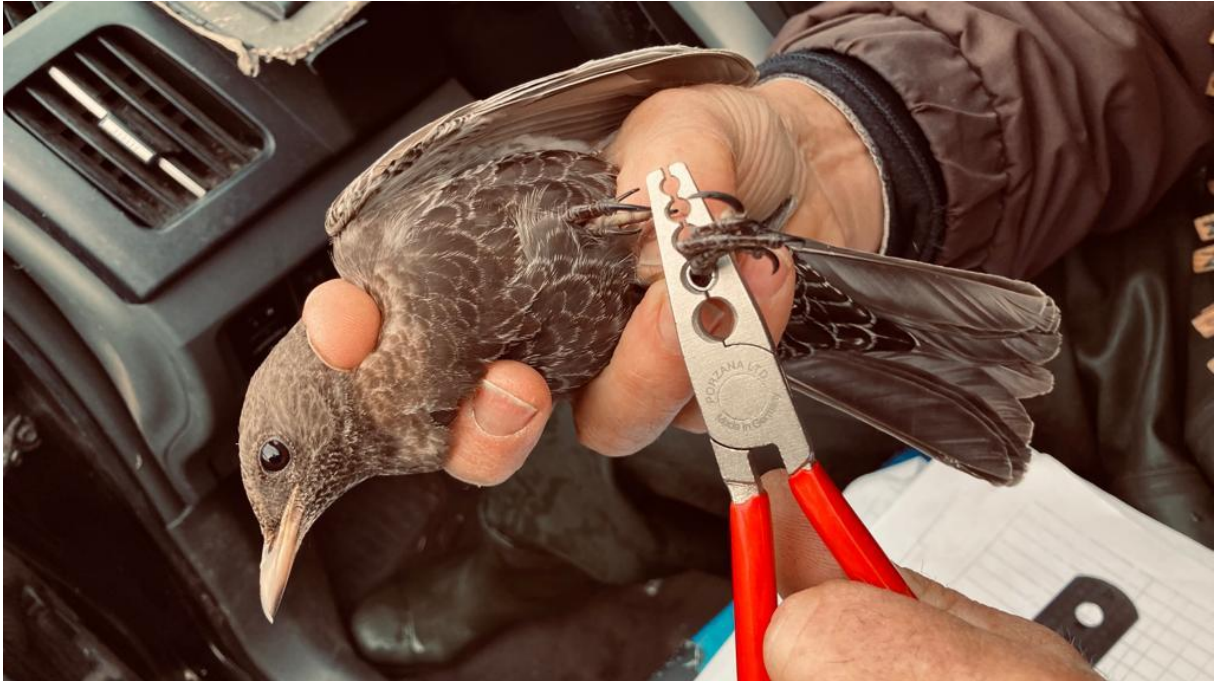
Beflijster ad vrouw