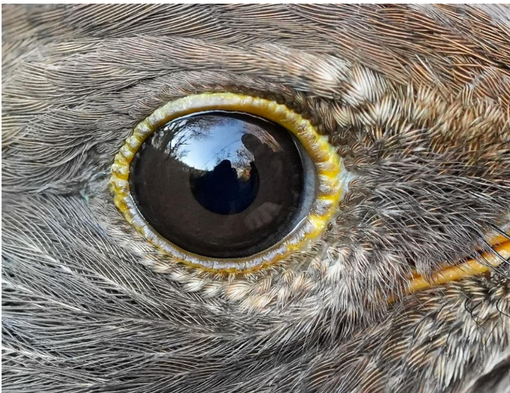
Merel vrouw 1 kj ..... met ringer en fotograaf in spiegelbeeld .....

Vogeltrekstation (ring-terugmeldingen), Trektellen.nl (statistieken, zoals ook jaartotalen), Natuurvereniging Wierhaven (archiveren Jaarverslagen zodat ze ook voor belangstellenden toegankelijk zijn), waarneming.nl (vastleggen van waarnemingen, ook weer toegankelijk voor een ieder) en de Sovon werkgroep NESTKAST droegen weer bij aan het vastleggen van ringgegevens evenals van de waarnemingen die terloops tijdens het ringen werden gedaan.